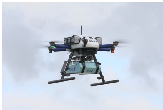
ドローン配送イメージ

2021年6月に内閣官房・厚生労働省・国土交通省より「ドローンによる医薬品配送ガイドライン」が策定されました。アインHDとANAHDは、2021年10月にこのガイドラインに基づく日本初の実証実験を行い、ガイドラインの解釈と課題抽出を行いました。本分科会では、旭川市のような人口密集地域における同ガイドラインに準拠したドローンによる非接触医薬品配送と、積雪寒冷地における無人・自動物流の検討を行います。