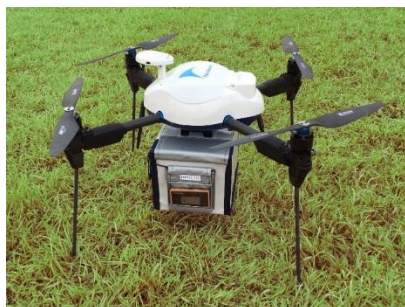
ドローン機体(エアロセンス)

医薬品や日用品などの恒常的な配送体制維持が困難となりつつある地域の課題解決と、ウィズコロナ時代における診療・服薬指導及び配送時の感染リスク低減に貢献してまいります。