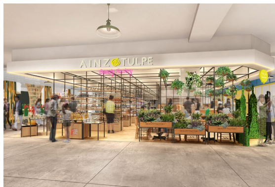
アインズ&トルペ 外観イメージ