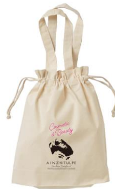
オードリー・ヘプバーン 期間限定デザイングッズ ポイントカード(左)、トートバッグ(右)