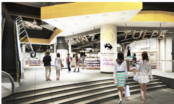
東池袋店 外観イメージ